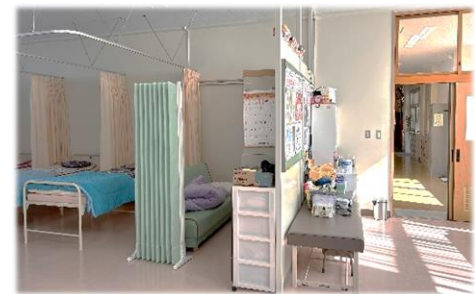
(←執務机から見た保健室内の様子)